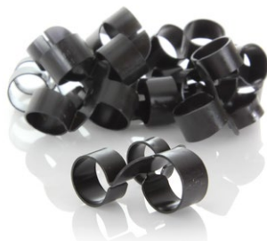
linky (nábojové pásy) - TOP 2 v Evropě s výrobní kapacitou naplněnou na dva roky dopředu