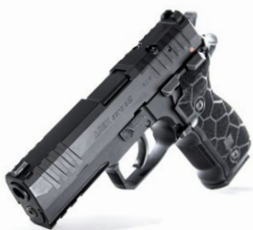
pistole AREX Zero, AREX Delta a AREX Alpha