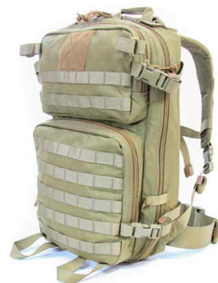
speciální vojenský textil (vesty, batohy)