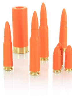
cvičná, nesmrtící munice - pouze tři výrobci na světě